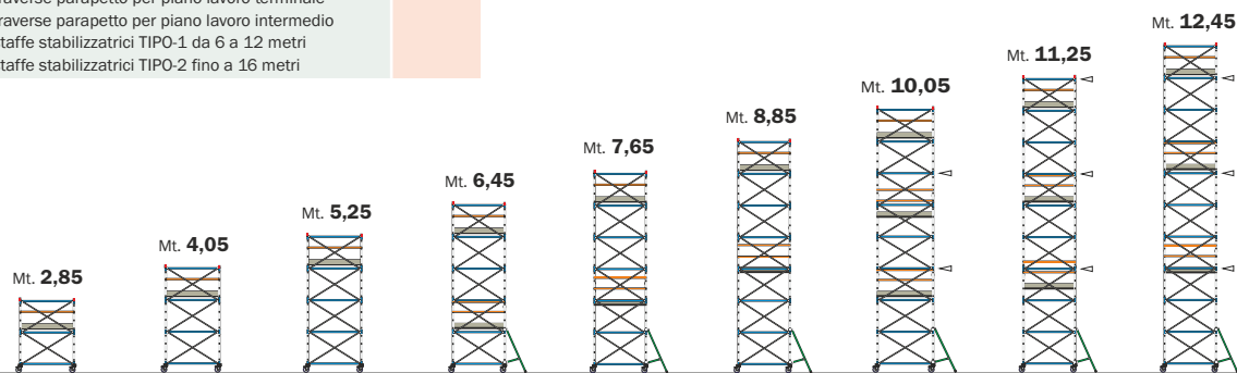
EXP-HD-02 EXP-HD-03 EXP-HD-04 EXP-HD-05 EXP-HD-06 EXP-HD-07 EXP-HD-08 EXP-HD-09 EXP-HD-10

LEGENDA : ◁ - Ancoraggio obbligatorio in esterni