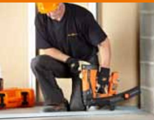
Profili in acciaio per pareti a secco