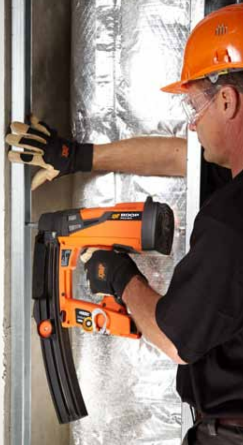
Caricatore da 50 chiodi [opzionale]

ADDIO a punte, tassellatori ed avvitatori, STOP a polvere e alle vibrazioni, BASTA a tanti attrezzi e manutenzioni.