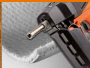
Impermeabilizzazioni con teli o pannelli bentonitici