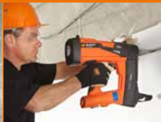
Perimetrali per controsoffittature