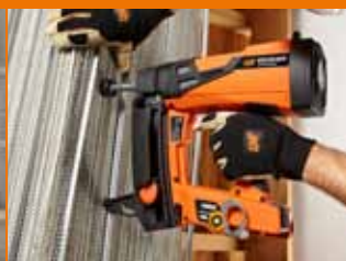
Reti per armatura intonaci