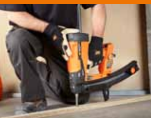
Listellature in legno